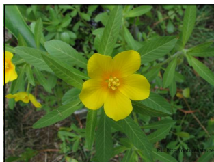
Doc. 1 Présentation de la jussie (Bordas cycle 3 - 2016)

Sous le tapis de jussie, l'obscurité règne, empêchant le développement de toute autre vie végétale.